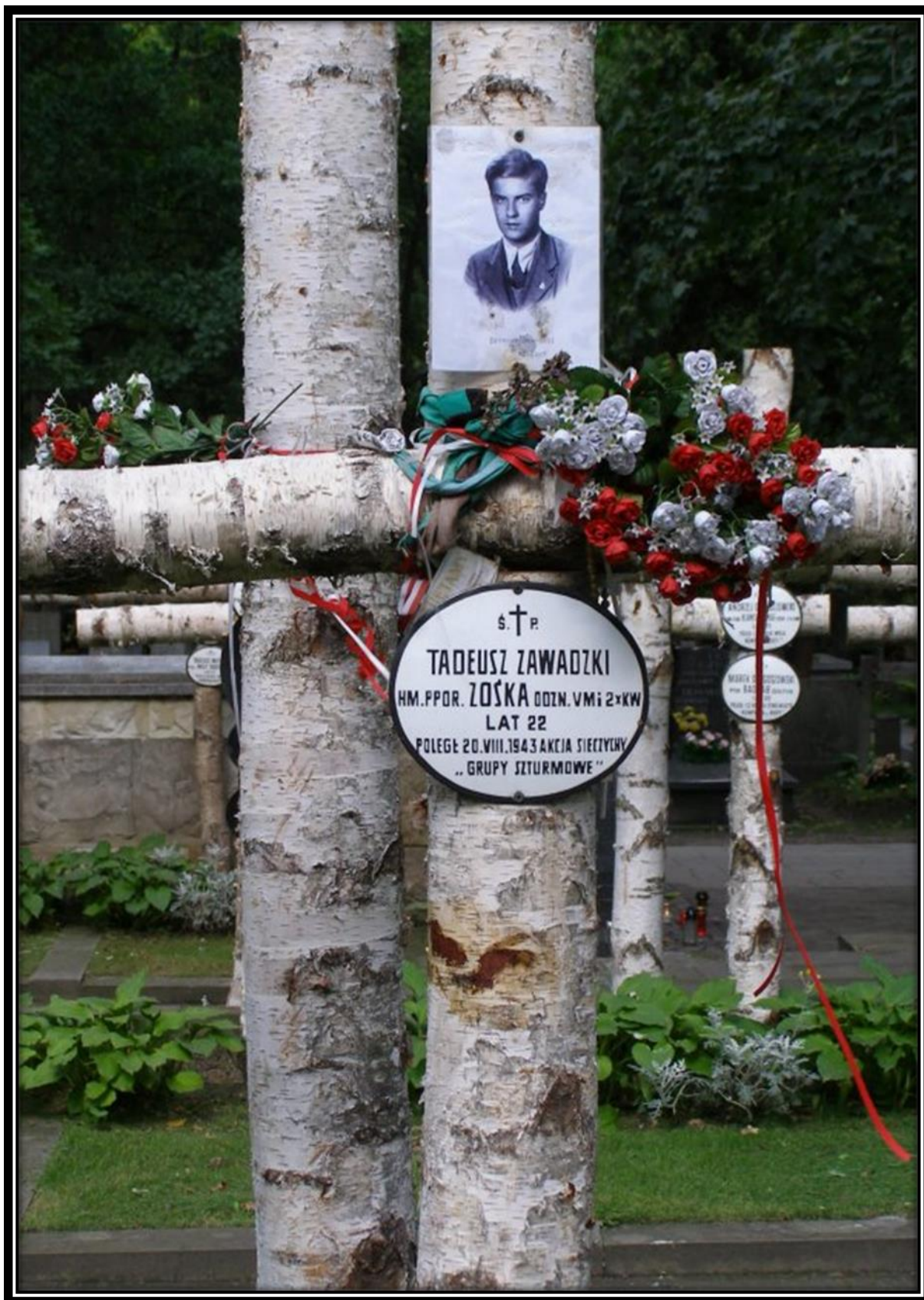
Grób Zośki na Powązkach